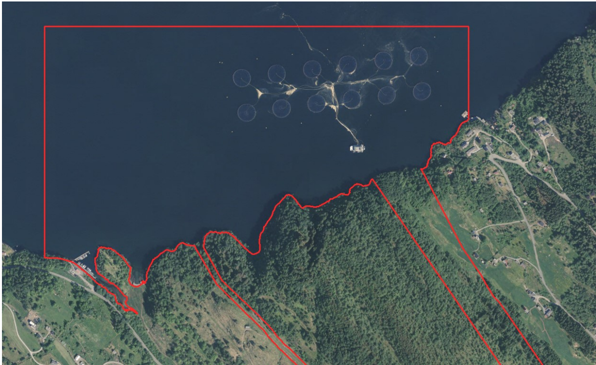
Figur 4 Utsnitt viser plassering av oppdrettsanlegget ved Tepstad i forhold til planavgrensinga. Ny trasé er vist til høyre i utsnittet. Eksisterande trasé ligg mot venstre.

Planen må og ta omsyn til kommunal vassleidning som går tett opp i strandsona.