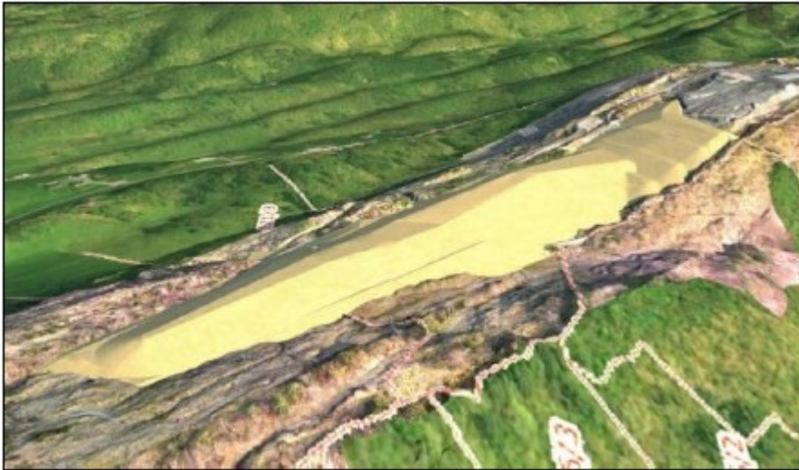
Figur 5 Utsnitt visar planlagt utviding av deponiet.

Det vil vere krav at deponiet skal gjerdast inn så lenge det er aktivitet på deponiet, og minimum 10 år etter avslutning. Dette er som eit avbøtande og førebyggjande tiltak, og det vert sett opp skilt ved anlegg for deponigass og reinseanlegget for å informere om risikoen med bruk av open eld i området.