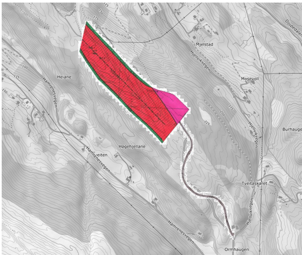
Figur 1 - Utsnitt viser Reguleringsplan for Mjelstad Restdeponi, vedteke 29.04.1998

Planinitiativet legg ikkje opp til auke i trafikk til anlegget.