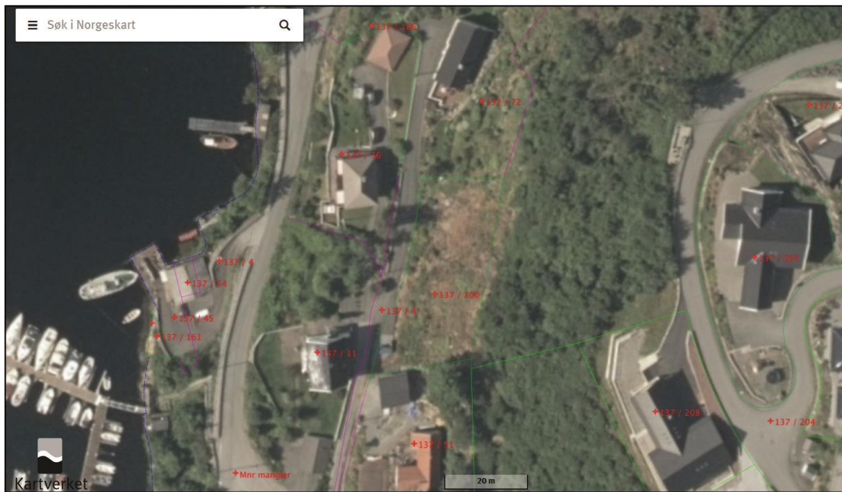
Figur 7: Flyfoto over planområdet og området rundt. Viser at det veks tett lauvskog like over øvre plangrense og opp til toppen i Bullåsen.