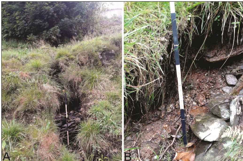
Figur 2: A: I sørlege del av tomta renn det ein bekk som har grave seg ned gjennom lausmassane til fast fjell. B: Lausmassane består av morenemateriale frå grov silt/sand til blokker.