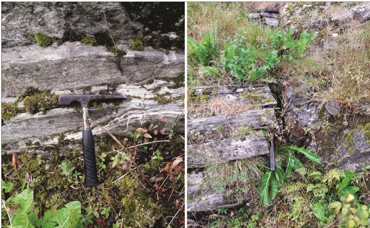
Figur 6: Bergarten er gneis som har foliasjon omtrent normalt på skråninga. Bergarten sprekk opp langs foliasjonen og fører til flate blokker som ligg i skråninga.