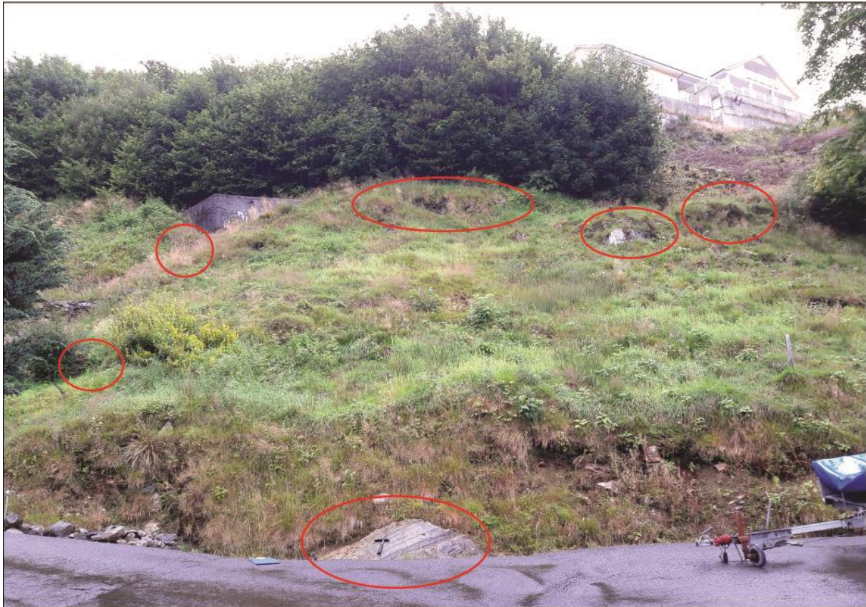
Figur 3: Område med fjell i dagen