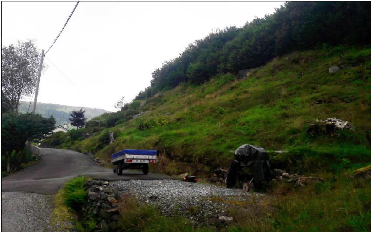
Figur 1: Byggetomta er i skråninga opp til skoggrensa. Biletet er tatt mot nord.