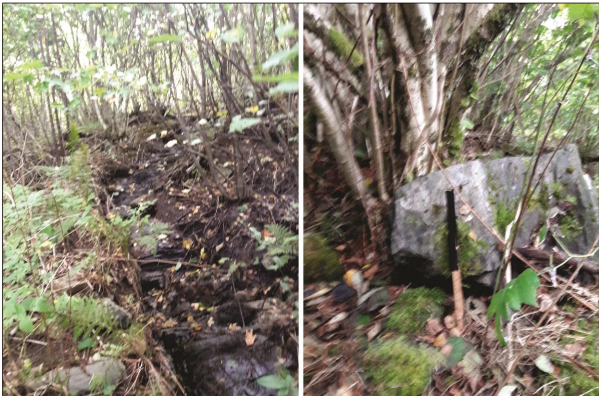
Figur 4: Skråninga aust for planområdet er prega av eit tynt torvlag over fast fjell. Det er observert fleire blokker som støttar seg til trea.