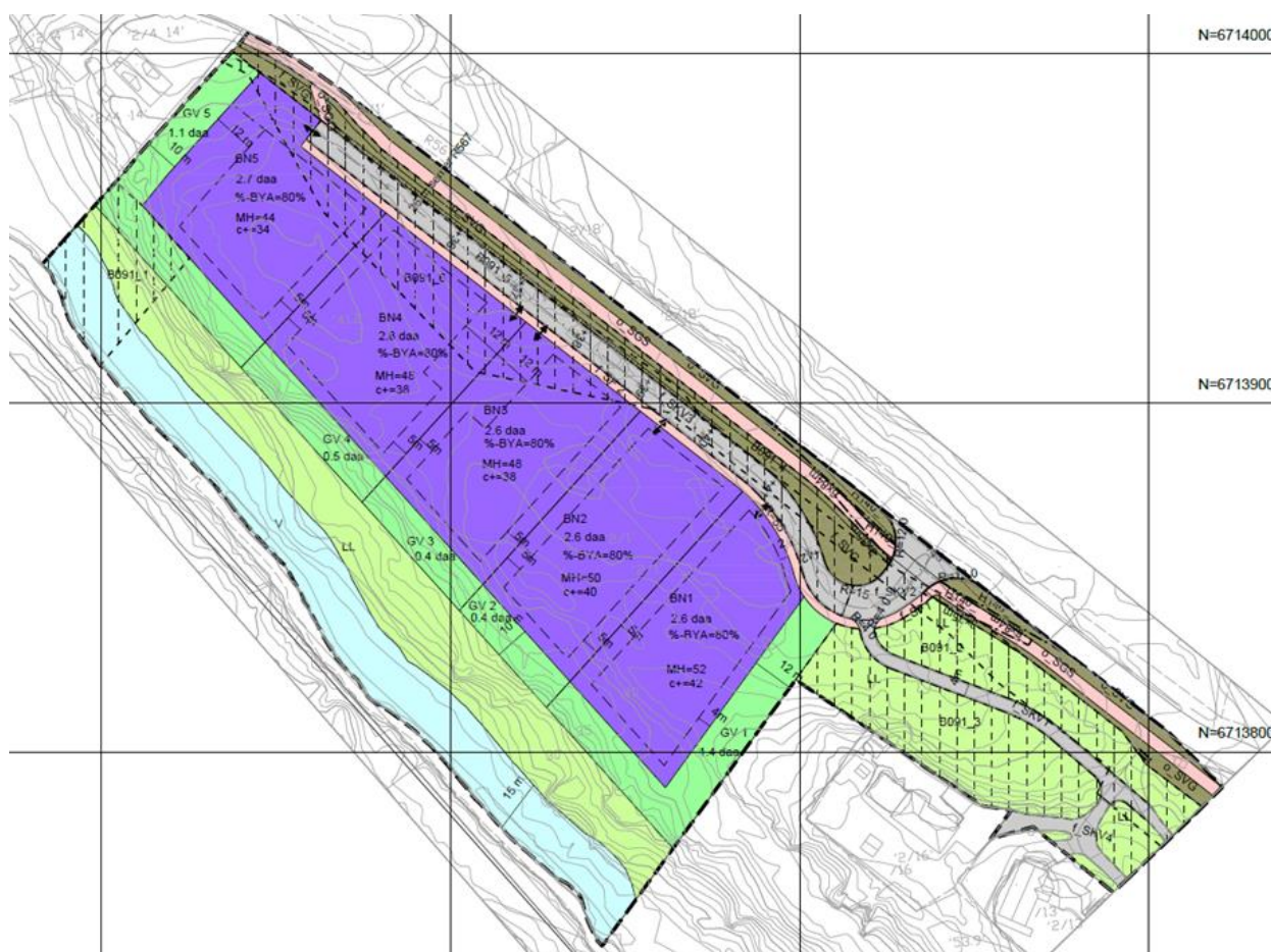
Figur 1 Gjeldande reguleringsplan

Dei nemnde endringar fører til mindre endringar i føresegnene. Disse endringane går fram av Planskildring av endring av reguleringsplan, dagsett Multiconsult 15.12.2021 og liste over endringar, dagsett 15.12.2021.